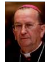
abp Henryk J. Muszyński Prymas Senior